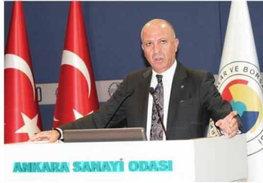
ANKARA SANAYİ ODASI